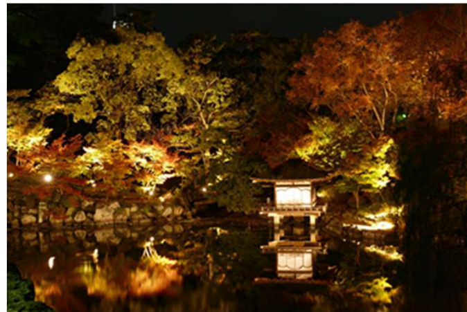
紅葉溪庭園 ライトアップ