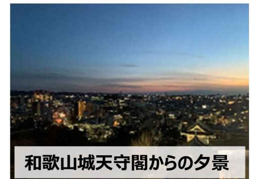
和歌山城天守閣からの夕景