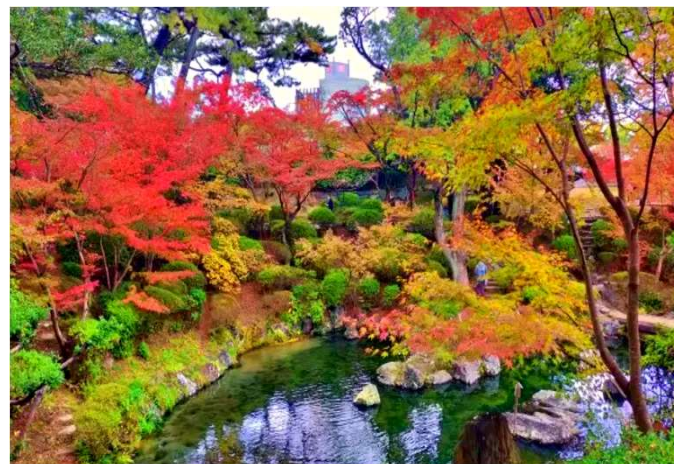
紅葉溪庭園 11月下旬頃