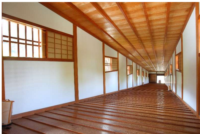
和歌山城 御橋廊下