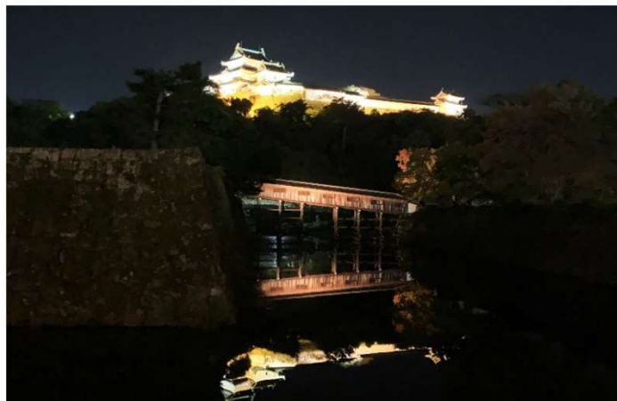
和歌山城 夜の全景

紅葉の時期、庭園の一部を夜間特別開放し、ライトアップした紅葉溪庭園を鑑賞できるようにする。竹のオブジェや和歌山城とのフォトスポット設置、お堀をまたぎ、藩主とお付きしか通れなかった御橋廊下も夜間開放するなどの特別体験を検討しております。